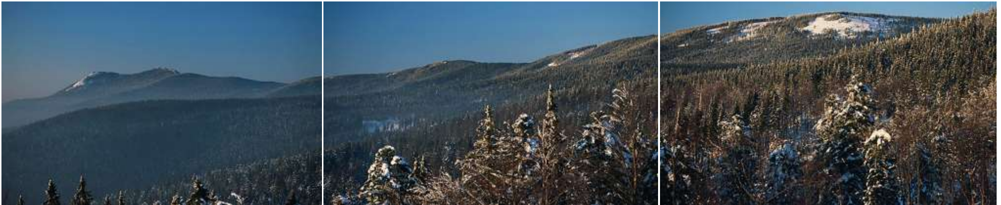
Dreifeld-Projektion - Diashows in Überblendtechnik und Parallelprojektion mit sechs Projektoren auf drei Leinwände - Dauer der Diashows 3 x 20 min